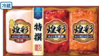
商品番号 008 3,024円(KK-403 4,320円) ●特撰ホワイトロースハム350g ●あぶり焼 焼豚180g ●あぶり焼ミートローフ170g