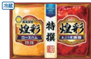
商品番号 010 2,268円(KK-302 3,240円) ●特撰ロースハム350g ●あぶり焼 焼豚180g