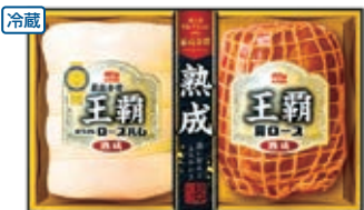
商品番号 004 3,780円(HA-502 5,400円) ●熟成ホワイトロースハム380g ●熟成肩ロース300g