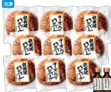
商品番号 022 2,646円(MHB-35 3,780円) ●鉄板焼ハンバーグ135g×6パック ●チーズ入りハンバーグ135g×3パック ●トリュフ仕立てアミグラスソース90ml ●トリュフ仕立て和風ソース90ml