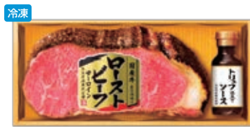
商品番号 013 4,536円(GM-60 6,480円) ●国産牛ロースビーフ(サーロイン)350g ●トリュフ仕立てソース90ml