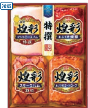
商品番号 006 3,780円(KK-504 5,400円) ●特撰ホワイトロースハム350g ●あぶり焼 焼豚180g ●特撰スモークハム180g ●あぶり焼ミートローフ170g