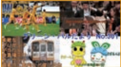
「グリーン・パルだよりNo.301」のご紹介動画

なお、動画の内容につきましては、下記の動画を参考にしてください。お待ちしております。