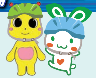
▲仙台ひと・まち交流財団交通安全指導課交通安全キャラクター「びーた」

応募期間 12/15(金)~2/29(木) 必着 レシート対象期間 12/15(金)~2/29(木) 申込はこちら 対象 購入金額3,000円以上の自転車用ヘルメット 1個につき2,000円分のQUOカードPayを抽選でプレゼント 。1会員につき最大5個まで、総計で200個分までを上限とさせていただきます。