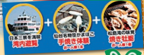
日本三景を満眼 湾内遊覧