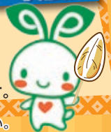
松島湾の味覚 焼き牡蠣 9:00～16:00